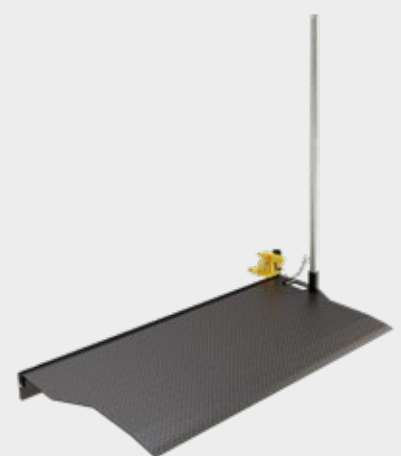
Van Bridge Plate Überladebrücken