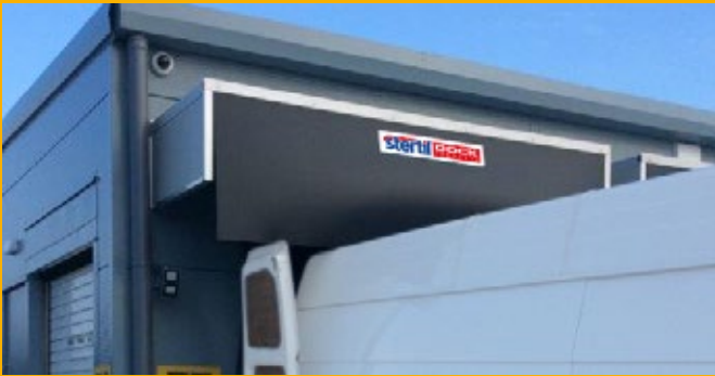
Speziell entwickeltes Dach gegen Wind und Regen