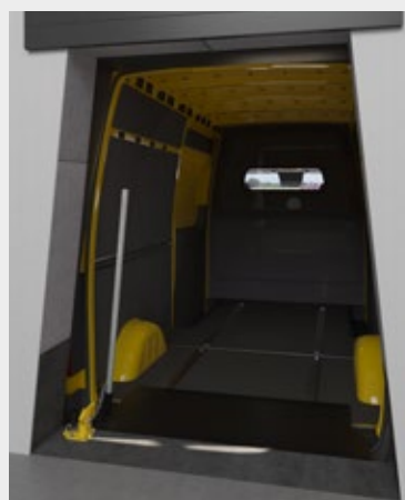
Überladebrücken vom Lagerinneren aus gesehen

Für kleinere Transportfahrzeuge ist optional ein aufblasbares Kopfkissen erhältlich. Dieses trägt dazu bei, dass eine optimale Abdichtung und weniger Temperaturschwankungen sowie Zugluft beim Be- und Entladen erreicht werden.